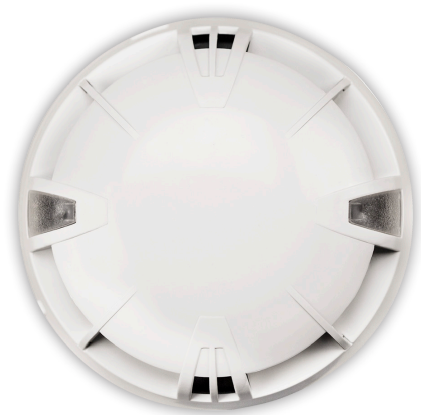
EV SMK BWL F102EVSMKBWL

EV SMK BWL è un rivelatore ottico di fumo wireless per interni, con montaggio a soffitto, la cui tecnologia di rilevazione sfrutta l'effetto Tyndall.